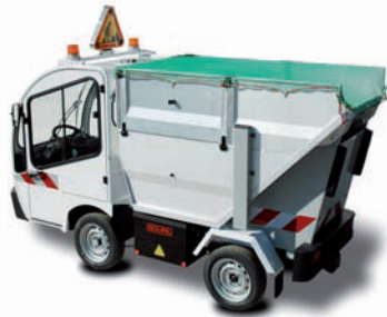
Filet sur la benne