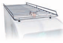
Galerie sur toit