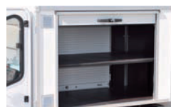
Aménagement intérieur (étagères)