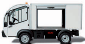
2 ème rideau latéral