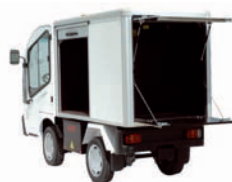
Spécial collecte de linge