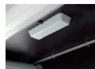
Lumière intérieure dans le fourgon