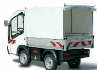
Bâche sur réhausse