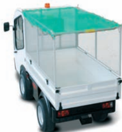
Filet sur réhausse