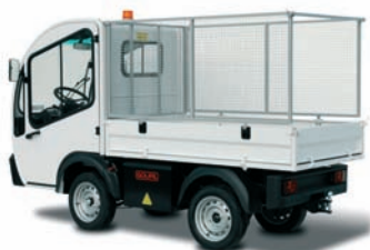
Réhausse grillagées escamotables et traitées anti-corrosion